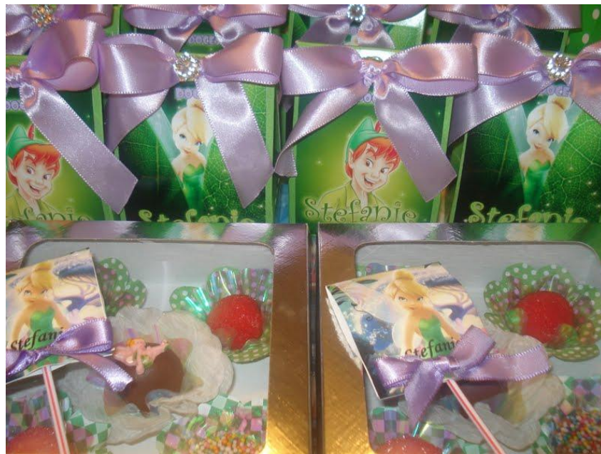
Caixinha de Doces Personalizada