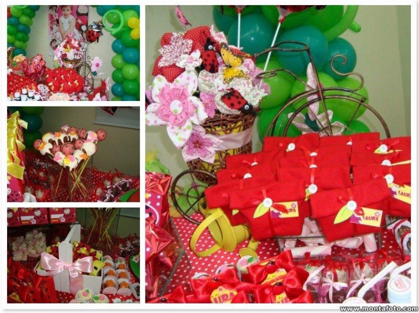
Mesa de Guloseima VI