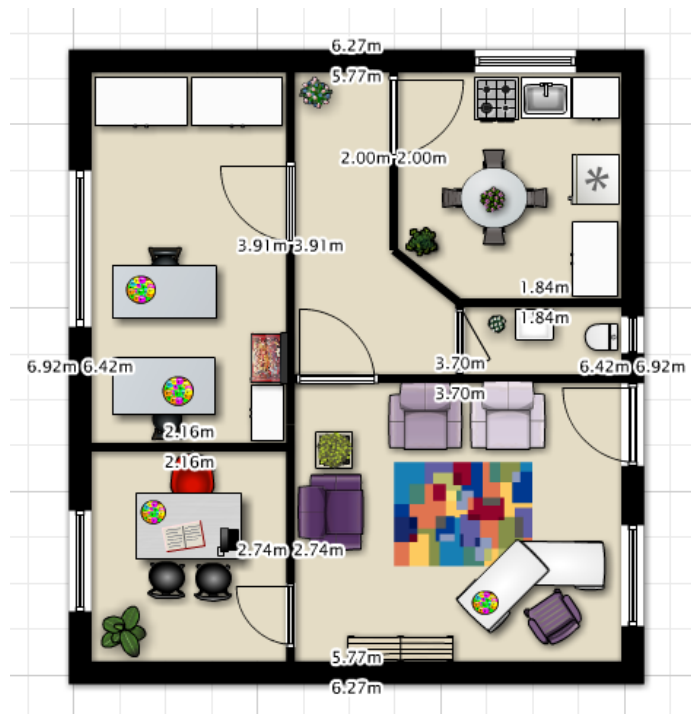
Quadro 1: Layout Fábrica de Sonhos

A Fábrica de Sonhos esta localizada na Rua Gertrudes de Lima, 279 A, bairro Centro de Santo André – SP. Nosso espaço é amplo para atendimento dos clientes, retirada de encomendas, confecção e demonstração dos nossos produtos, além de ser de fácil acesso aos clientes e possuir estacionamentos próximos.