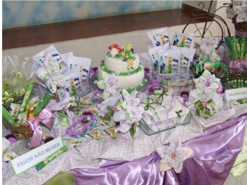
Mesa de Guloseima I