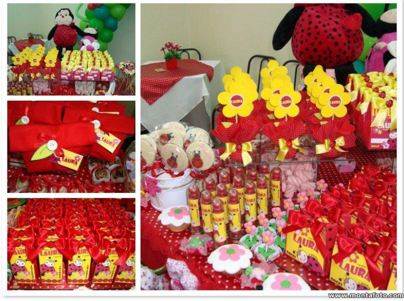
Mesa de Guloseima III