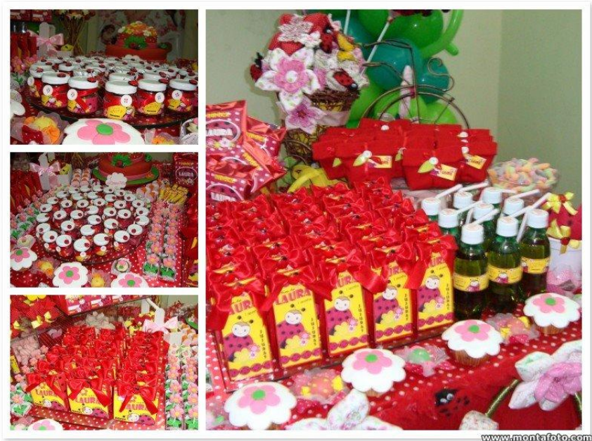
Mesa de Guloseima II