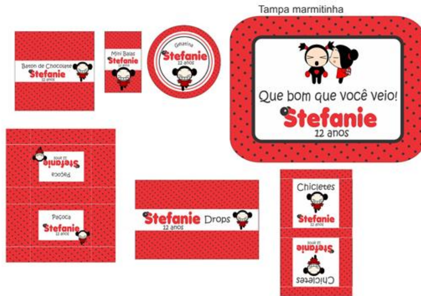
Layout – Exemplo