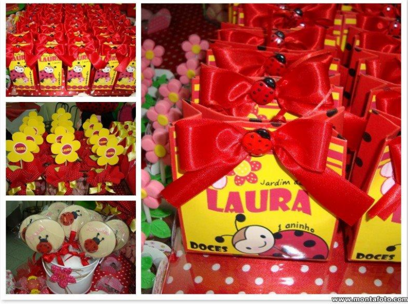
Mesa de Guloseima V